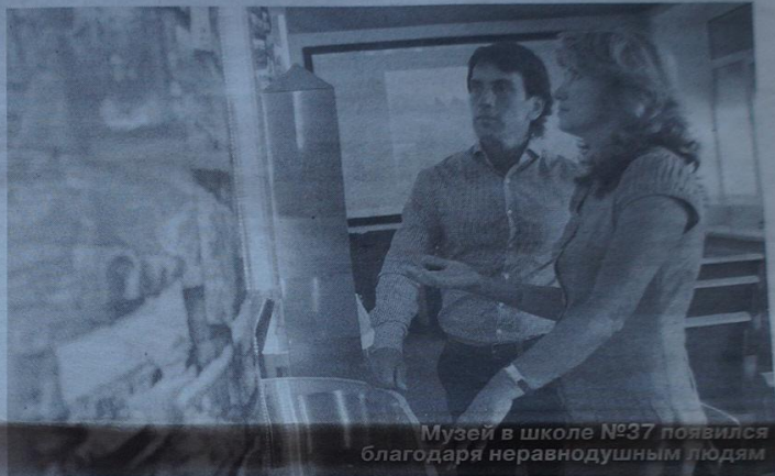
Музей в школе №37 появился благодаря неравнодушным людям