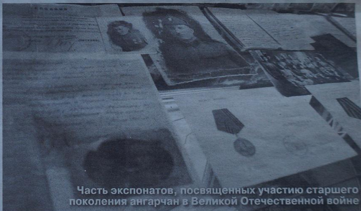
Часть экспонатов, посвященных участию старшего поколения ангарчан в Великой Отечественной войне